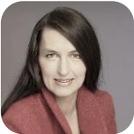
Kirsten Lühmann MdB SPD-Fraktion