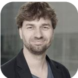
Stefan Gelbhaar MdB Fraktion Bündnis 90 / DIE GRÜNEN