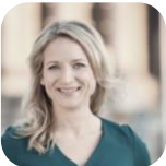
Daniela Kluckert MdB FDP-Fraktion