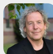
Prof. Andreas Knie

12:00 – 12:20 Uhr Interview 12:20 – 13:00 Uhr Podiumsdiskussion 13:00 – 14:00 Uhr Lunch-Break