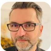
Dirk Ritter Behörde für Verkehr und Mobilitätswende (Hamburg)