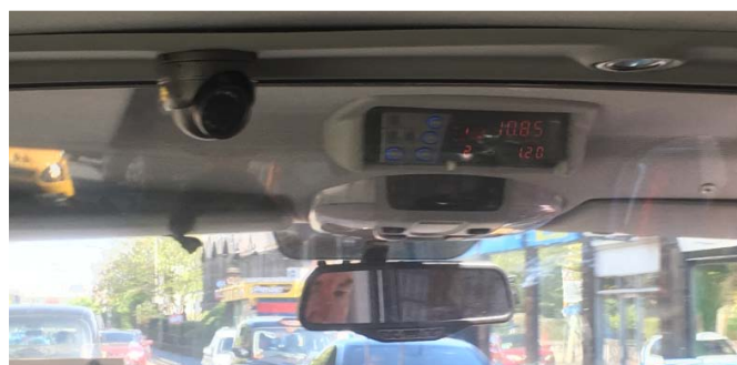
Blick in ein Taxi im schottischen Edinburgh - natürlich mit Überwachungskamera

Grundlagen der Videotechnik Zwar kann nicht jeder die nächstbeste Kamera aus dem Elektronikmarkt in sein Auto einbauen und munter drauflos filmen. Videoüberwachung zu Verhaltenskontrollen der Fah-