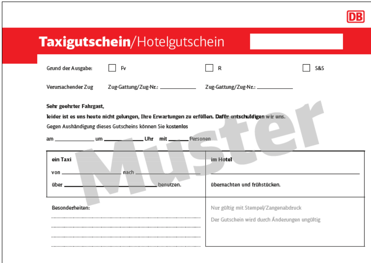
Abbildung eines Musters (Vorder- und Rückseite)